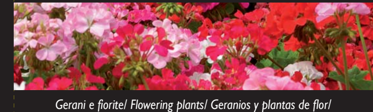
Gerani e fiorite / Flowering plants / Geranios y plantas de flor / Geránios e floração / Ανθοφόρα φυτά / Blütenpflanzen

CONCIME CE. Concime NPK 12-5-10 con ferro (Fe) ottenuto per miscelazione. COMPOSIZIONE: Azoto (N) totale 12,0%. Azoto (N) ammoniacale 1,0%. Azoto (N) ureico 11,0%. Anidride fosforica (P 2 O 5 ) solubile in citrato ammonico neutro 5,0%. Ossido di potassio (K 2 O) solubile in acqua 10,0%. Ferro (Fe) totale 2,0%. VANTAGGI DI ONE MICRO-GRANULARE: Il prodotto rilascia rapidamente gli elementi nutritivi per ottenere piante rigogliose, sane e con abbondante fioritura e fruttificazione. La forma in micro-granuli del prodotto rende semplice l'applicazione e allo stesso tempo costante una distribuzione uniforme su tutta la superficie interessata. MODALITA' DI UTILIZZO: Per le piante da esterno distribuire una manciata di prodotto (50 g) per ogni m 2 di superficie e annaffiare. Ripetere l'applicazione non prima di 20 gg a seconda delle specifiche esigenze della pianta. Per le piante in vaso distribuire un cucchiaino di prodotto (3 g) ogni 10 cm di larghezza del vaso e annaffiare. Ripetere l'applicazione non prima di 20 gg a seconda delle specifiche esigenze della pianta. QUANDO SI UTILIZZA: tutti i mesi dell'anno. Ridurre la frequenza nel periodo invernale. AVVERTENZE E CONSIGLI: conservare in luogo fresco e asciutto. Tenere lontano dalla portata dei bambini e degli animali. Chiudere bene la confezione dopo l'uso.