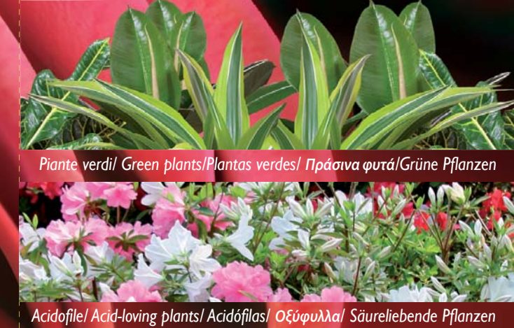
Plantae verdi / Green plants / Plantas verdes / Πράσινα φυτά / Grüne Pflanzen

PERTUTTE LETUE PIANTE / FOR ALL YOUR PLANTS / PARA TODAS TUS PLANTAS / PARA TODAS LAS SUAS PLANTAS / ΓΙΑ ΟΛΑ ΤΑ ΦΥΤΑ ΣΑΣ / FUER ALLE DEINE PFLANZEN