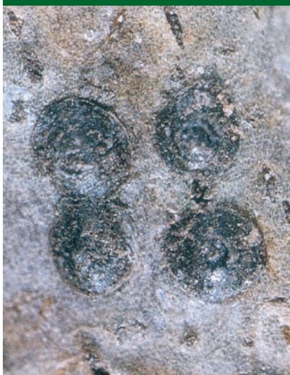
Ψώρα San Jose σε νεκταρινία