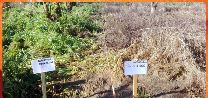
Αψέκαστος μάρτυρας συγκριτικά με ψεκασμένο με PLEDGE® + ROUNDUP®