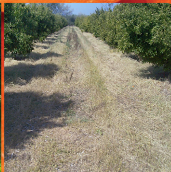
6 μήνες μετά από εφαρμογή PLEDGE® + ROUNDUP®