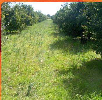
Πριν την εφαρμογή

B. Ενίσχυση της δράσης glyphosate: Με την προσθήκη του PLEDGE® , καταπολεμούνται αποτελεσματικότερα δύσκολοεξόντωτα ζιζάνια όπως π.χ Μολόχα, Αντράκλα κ.α. και ταυτόχρονα όλα τα ζιζάνια ξεραίνονται πιο γρήγορα.