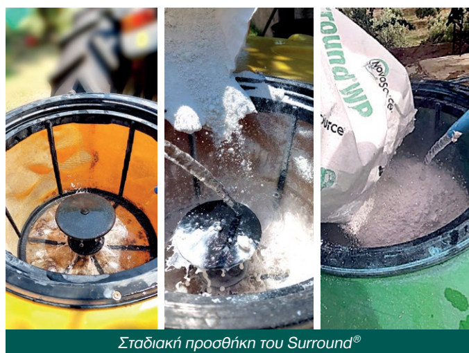
Σταδιακή προσθήκη του Surround ®

ΠΡΟΣΟΧΗ! ΔΕΝ ΑΔΕΙΑΖΟΥΜΕ το σάκο του Surround ® ΑΠΟΤΟΜΑ και ΑΠΕΥΘΕΙΑΣ μέσα στο βυτίο, γιατί δεν προλαβαίνει να διαλυθεί και «κάθεται» ως ίζημα στον πάτο του βυτίου, δημιουργώντας πρόβλημα στον ψεκασμό (φραγμένα μπεκ και σίτα, όχι ομοιόμορφος ψεκασμός κ.λπ.).