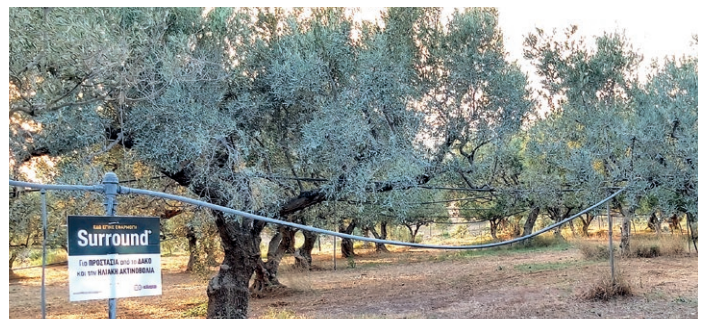
Σωστή ομοιόμορφη, καθολική, επικάλυψη

Να αποφεύγεται η χρήση μπέκ μεγαλύτερης διαμέτρου (π.χ. 2 ή 2,5 mm), για να μην υπάρχει απορροή του ψεκαστικού διαλύματος από το φύλλωμα των δένδρων.