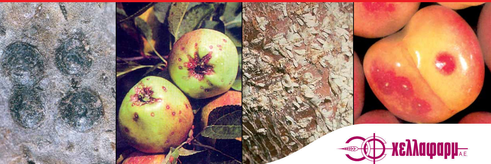
Ψώρα San Jose σε νεκταρινία